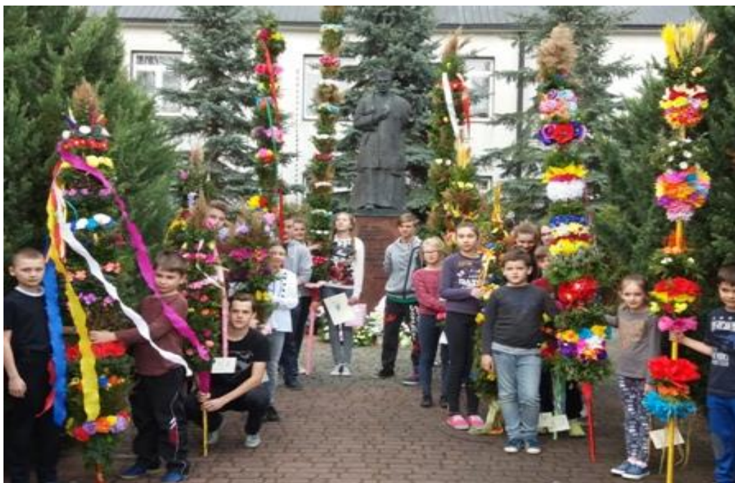
Fot. Palmy wykonane przez uczniów Zespołu Szkół im. Ks. Prałata Stanisława Sudoła w Dzikowcu

Zwycięzcom gratulujemy, wszystkim dziękujemy za zaangażowanie w podtrzymywanie tej tradycji, a szczególne wyrazy wdzięczności kierujemy do sponsorów za ich otwarte serca i hojność.