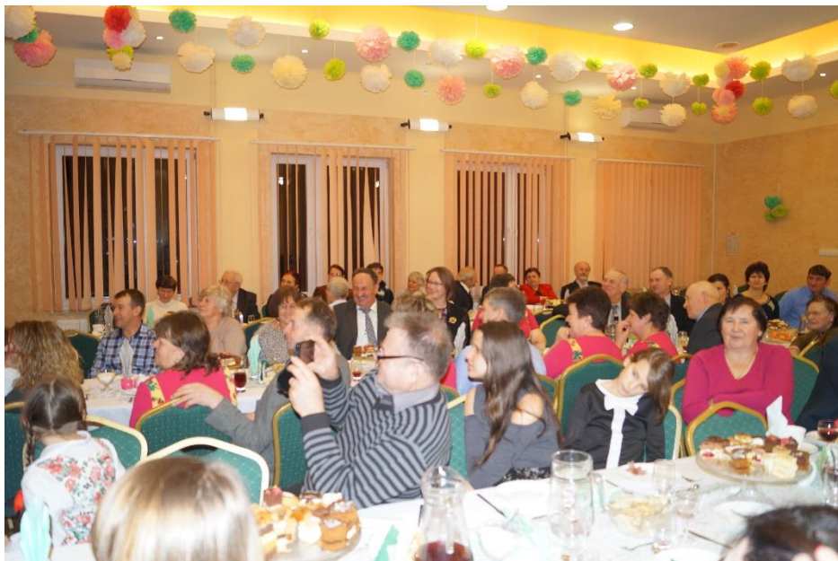
Fot. Mieszkańcy i zaproszeni goście podczas Dnia Seniora w Mechowcu.