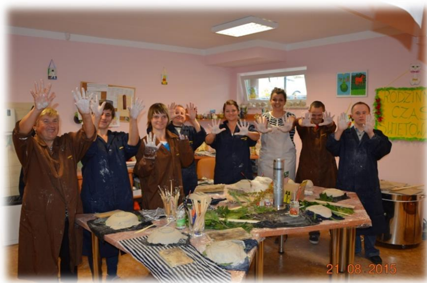
Fot. W trakcie warsztatów twórczej pracy w glinie