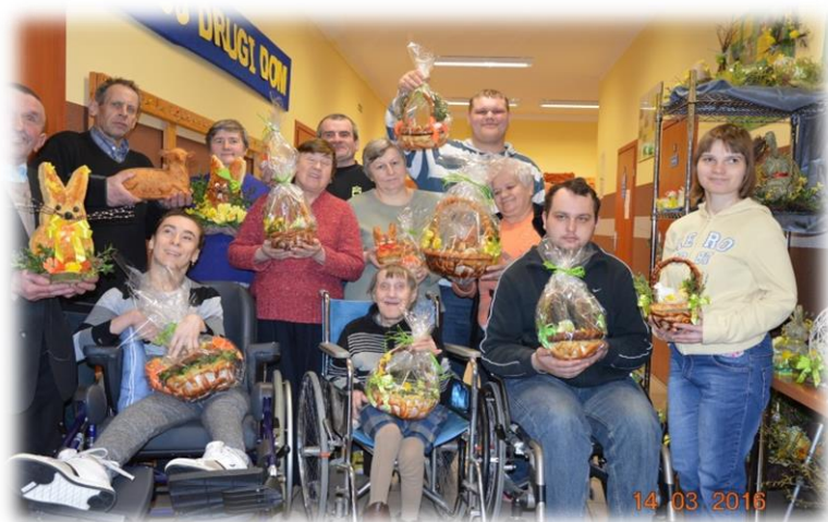
Fot. Tak zakończyły się wielkanocne inspiracje z ciasta drożdżowego

W Środowiskowym Domu Samopomocy w Spiach uczestnicy również mają możliwość wyrażać siebie samych poprzez twórczość. To jeden z elementów planu pracy z uczestnikami. W pracowni plastycznej oraz rzemieślniczej w trudach powstają różne „dzieła sztuki”. Prezentujemy je w trakcie licznych przeglądów, wystaw, kiermaszów. Nasi uczestnicy biorą także udział w wielu konkursach adresowanych do osób niepełnosprawnych. Ponadto w Domu odbywają się cykliczne zajęcia teatralne, w trakcie których uczestnicy przygotowują okolicznościowe przedstawienia. Form twórczości jest zatem wiele: począwszy od plastycznych, poprzez rzemiosło artystyczne, skończywszy na tańcu i formach teatralnych.