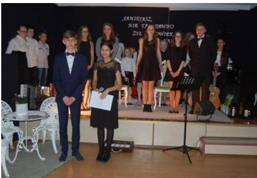
Fot. Uczestnicy koncertu pt: "Chlubnie uzdolnieni"