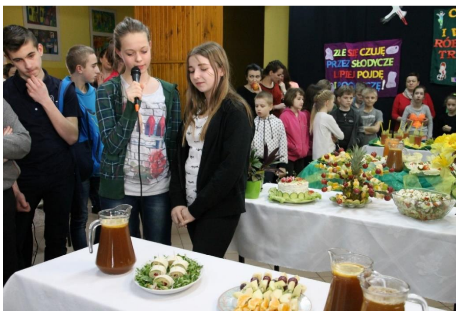
Fot. Podczas prezentacji kulinarnych