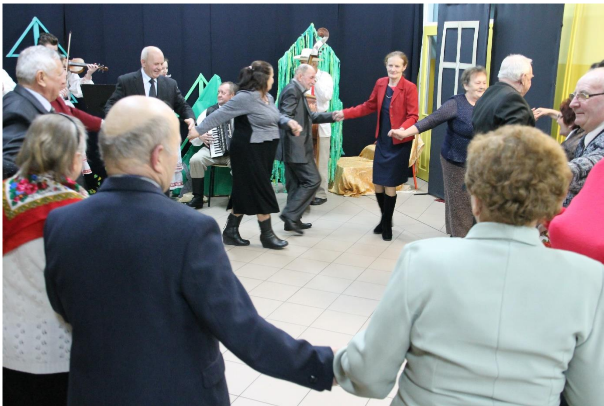
Fot. Podczas Dnia Seniora w Wilczej Woli