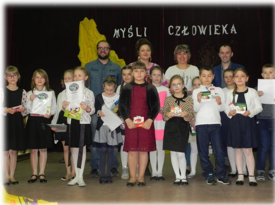
Fot. Zwycięzcy IV Powiatowy Konkurs Recytatorski im Poezji Religijnej im. Jana Pawła II „Myśli człowieka” (VIII edycja)