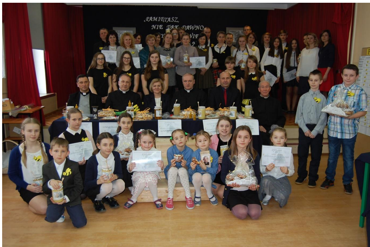
Fot: Uczestnicy turnieju