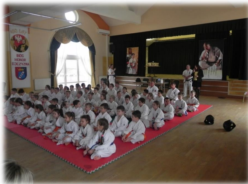
Fot. Uczestnicy biorący udział w III Turnieju Karate o Puchar Wójta Gminy Dzikowiec