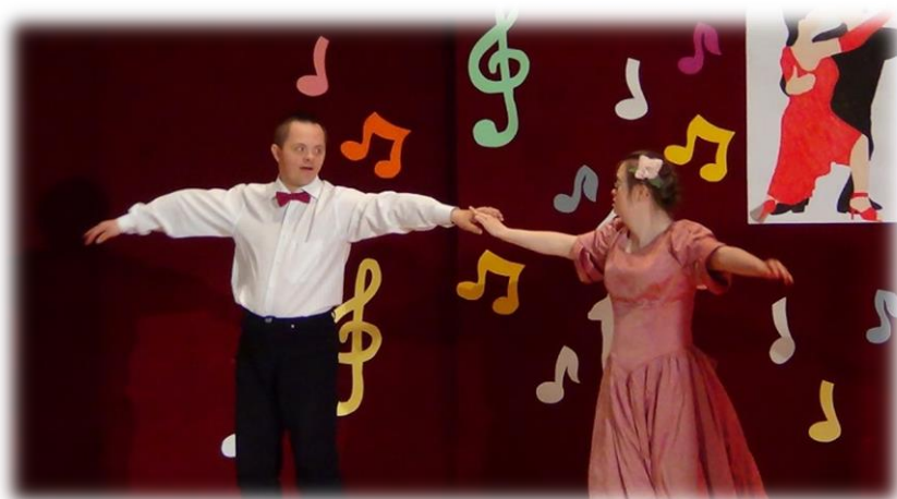
Fot. Konkurs tańca w Sandomierzu