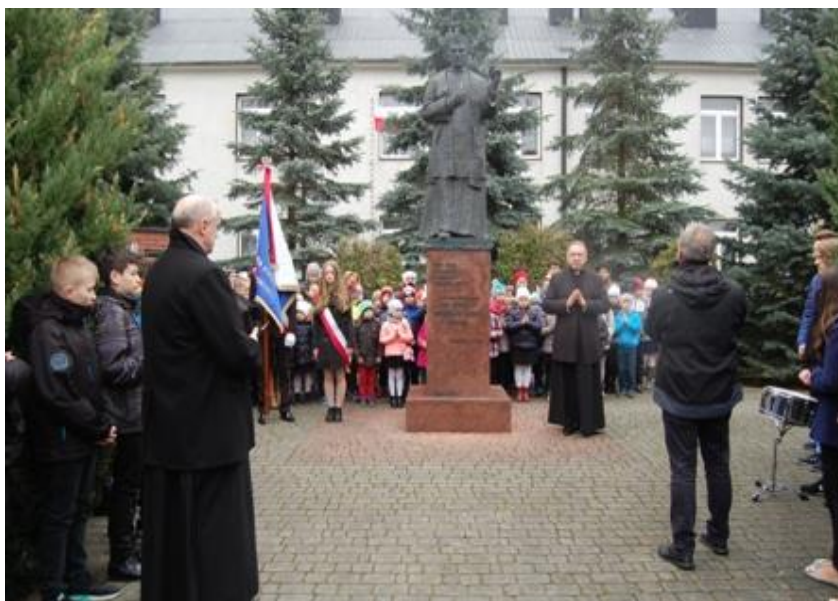
Fot. Uroczystości pod pomnikiem z okazji Dnia Patrona Szkoły w Dzikowcu

Gratulujemy uczniom talentu i wytrwałości w dążeniu do celu i życzymy wszystkim, aby tak jak Patron naszej szkoły, zawsze kierowali się dobrem drugiego człowieka.