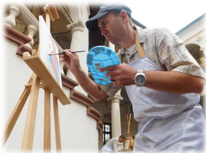
Fot. Podczas pleneru artystycznego na dziedzińcu Zamku w Baranowie Sandomierskim