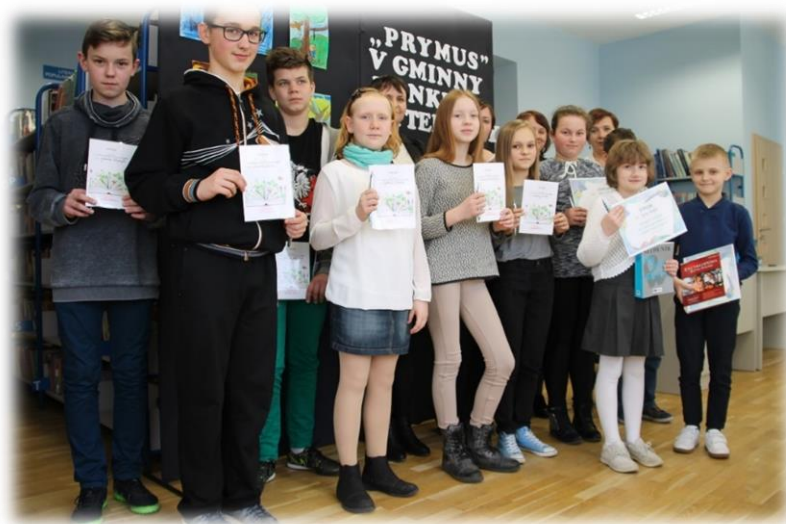
Fot. Nagrodzeni uczestnicy konkursu „Prymus”

Do zobaczenia w przyszłym roku szkolnym!